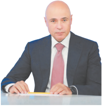
Игорь Артамонов, губернатор Липецкой области