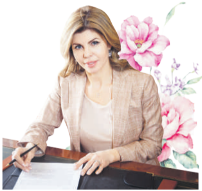
Евгения Уваркина, мэр Липецка